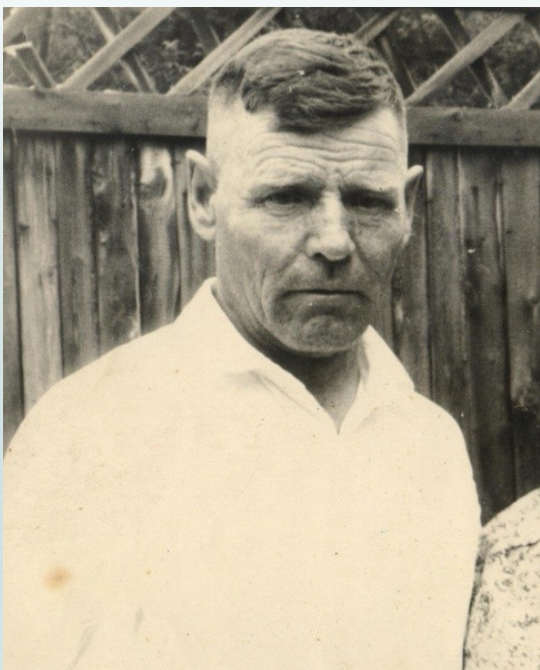
гвардии младший лейтенант

Старший механик-водитель самоходной установки ИСУ-122 из 399 гвардейского тяжёлого самоходно-артиллерийского ордена Ленина Проскуровского полка 11 гвардейского танкового Прикарпатского Краснознамённого ордена Суворова корпуса.